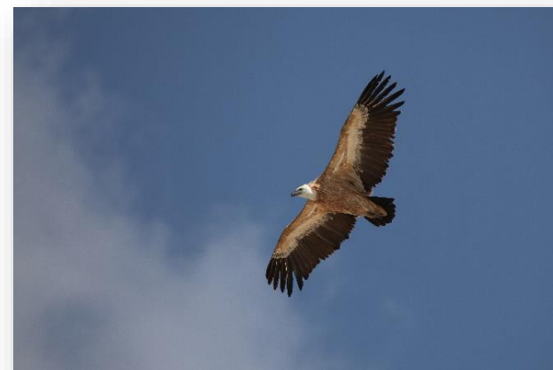
Γύπας - Gyps fulvus