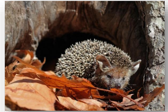
Hemiechinus auritus – Σκαντζόχοιρος