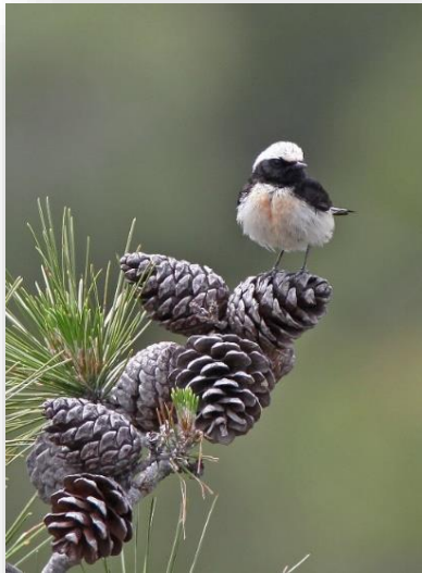
Σκαλιφούρτα Oenanthe cyriaca