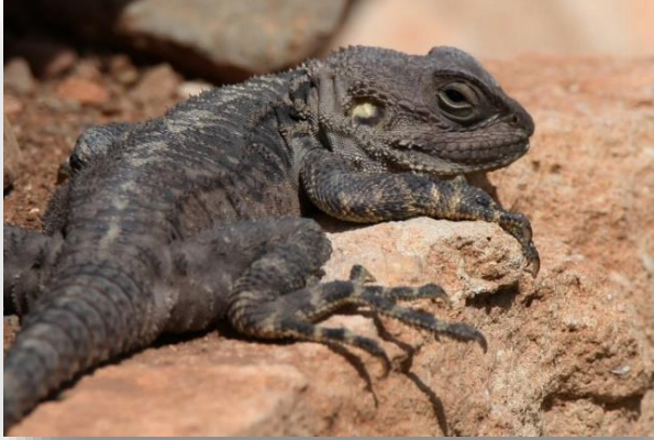
Κουρκουτάς - Stellagama stelio

Όλα τα είδη που απαντούν στην Κύπρο καταγράφονται εντός του ΕΔΠ Τροόδους