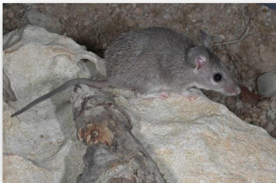
Acomys nesiotis – Ακανθοποντικός