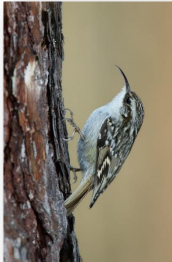
Δεντροβάτης Certhia brachydactyla dorotheae