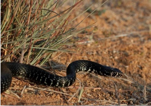
Hierophis cypriensis – Κυπριακό φίδι

Στο ΕΔΠ Τροόδους έχουν καταγραφεί τα 7 από τα 8 είδη της Κύπρου