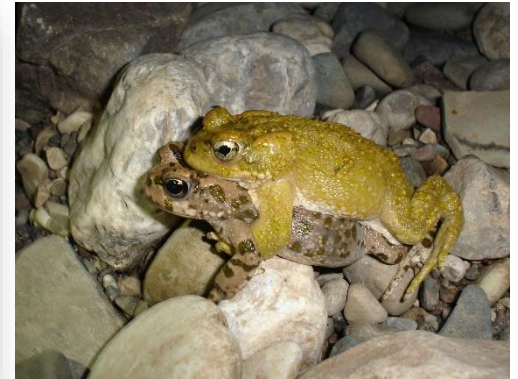
Bufo viridis - Πρασινόφρυνος