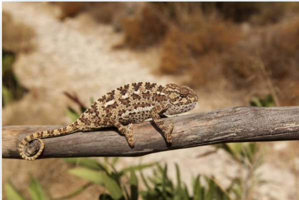
Χαμαιλέοντας – Chamaeleo chamaeleo