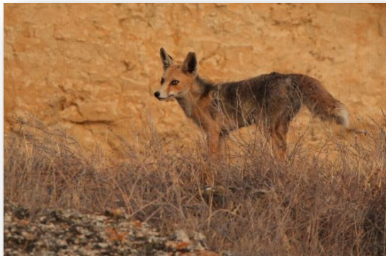
Vulpes vulpes – Αλεπού