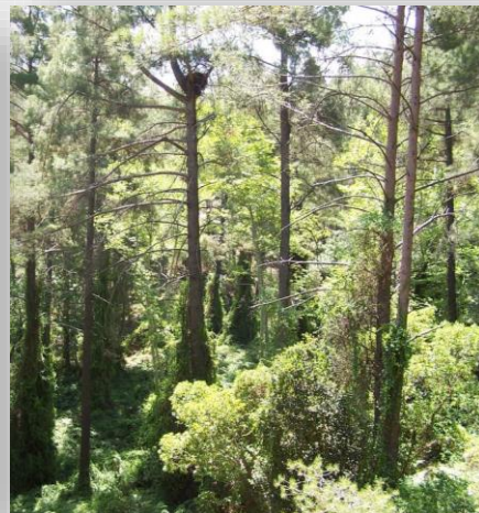
Διπλοσάχινο - Accipiter gentilis