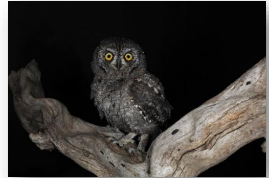
Θουπί - Otus cyprius