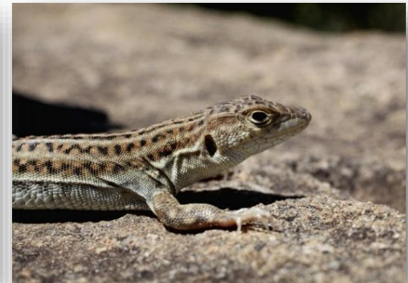
Ακανθοδάκτυλος Acanthodactylus schreiberi