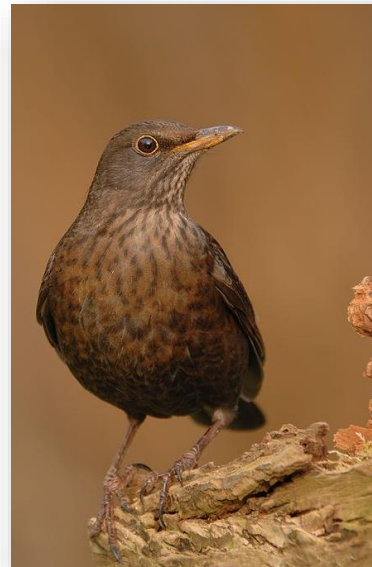
Κότσυφας - T. merula