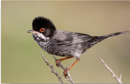
Τρυπομάζης – Sylvia melanothorax