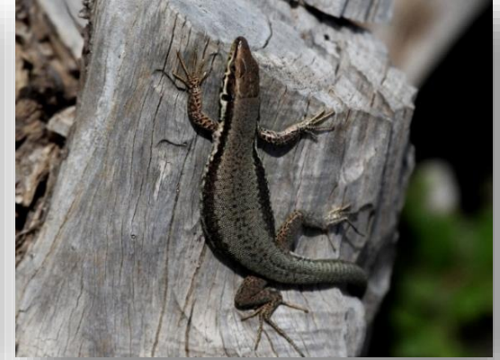
Σαύρα Τροόδους Phoenicolacerta troodica