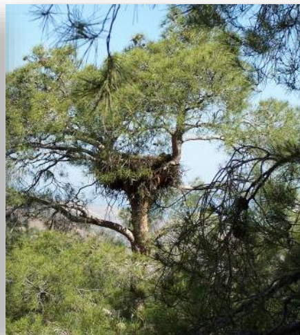
Σπιζαετός - Aquila fasciata