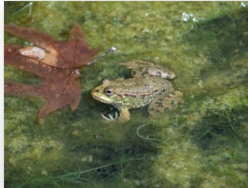
Rana bedriagae Βαλτόβιος βάτραχος