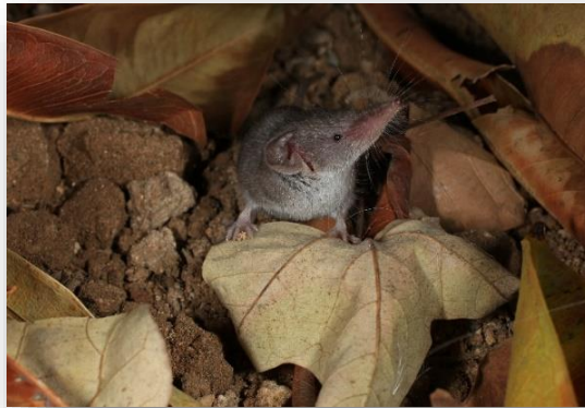
Crocidura suaveolens – Μυγαλή