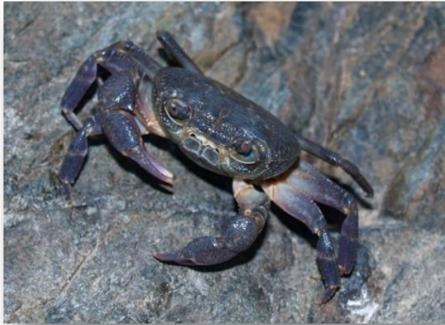
Κάβουρας του γλυκού νερού Potamon potamios