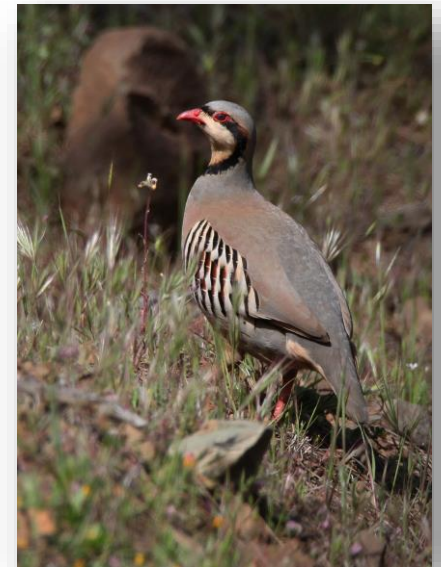
Πέρδικα - A. chukar