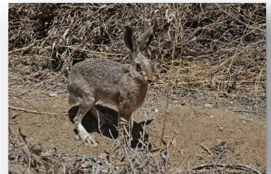
Lepus europaeus – Λαγός