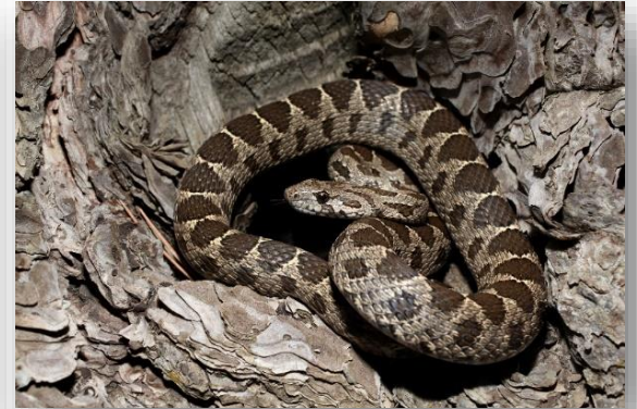
Hemorrhois nummifer - Δρόπης