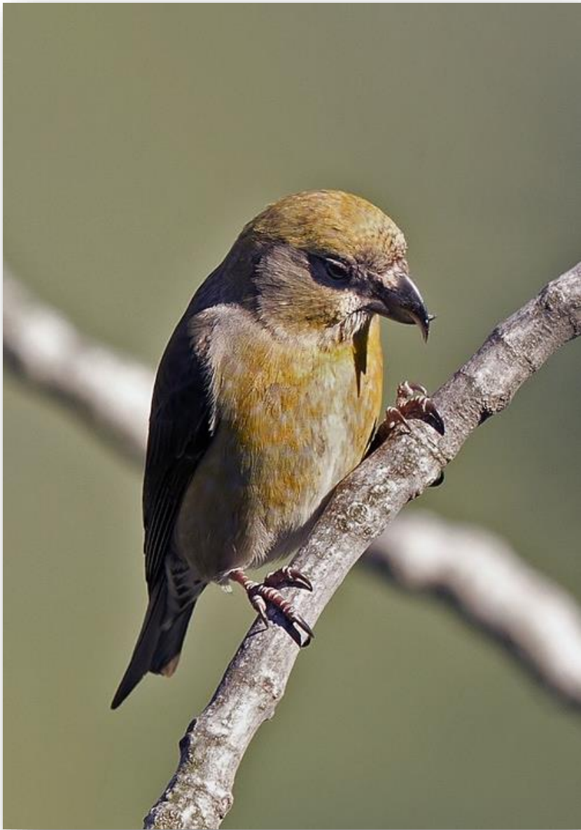
Σταυρομύτης - Loxia curvirostra