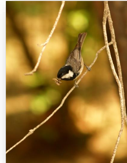
Πέμπετσος Periparus ater cypristes