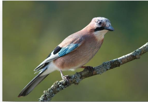
Κίσσα – Carrulus glandarius glaszneri