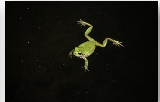
Hyla savignyi – Δενδρόβιος βάτραχος