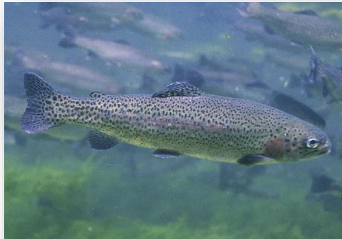
Oncorhynchus mykiss – Ιρ. Πέστροφα