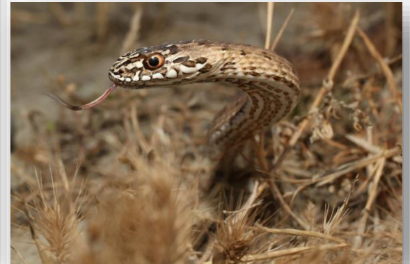
Malpolon insignitus – Σαίττα