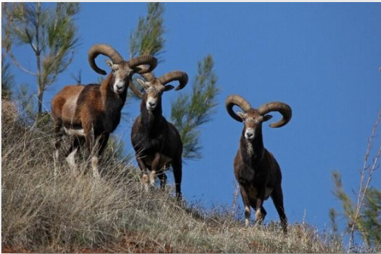
Αγρινό – Ovis gmelini orphion