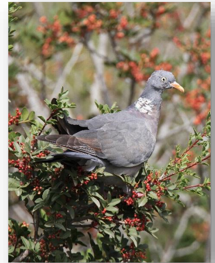
Φάσσα - C. palumbus