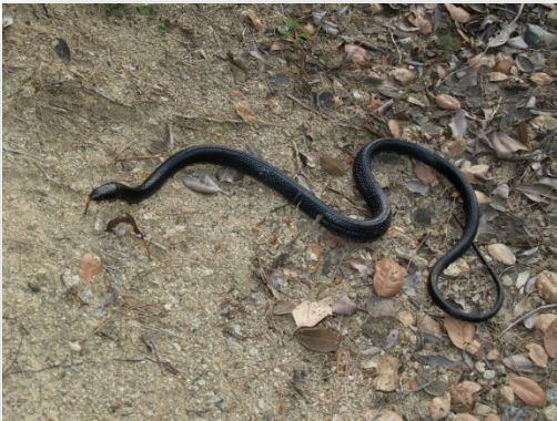
Θερκό - Dolichophis jugularis