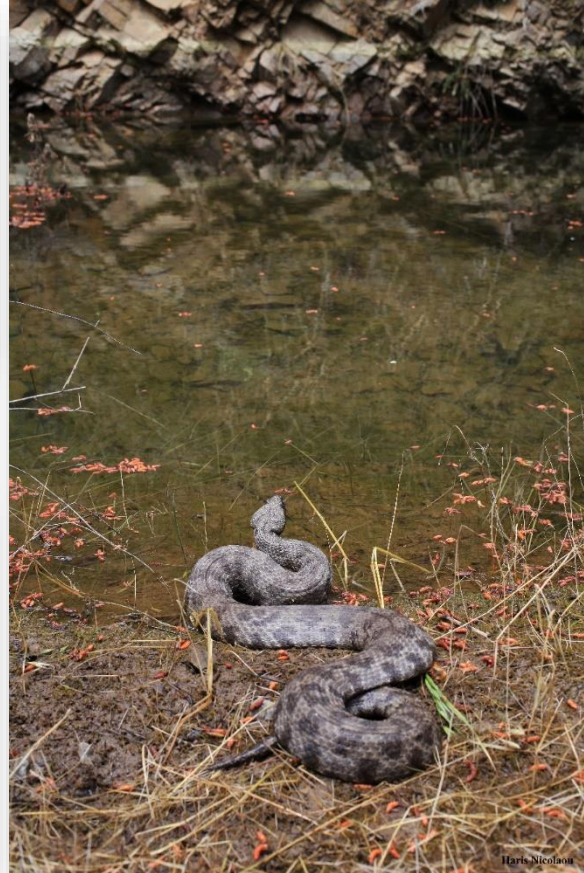
Macrovipera lebetina - Φίνα