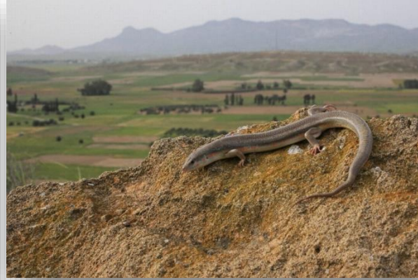
Ευμήκης – Eumeces shneideri