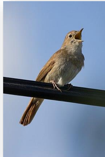
Αηδώνι - L. megarhynchos